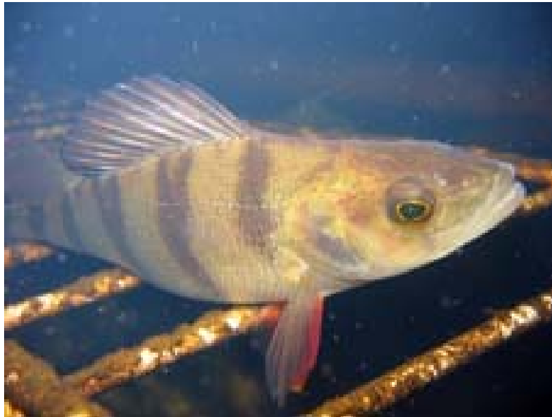
Tuskin enää koulutusta tarvitseva sukeltaja Ouluntullissa.

Mikäli koet kiinnostusta sukelluskurssien pitämiseen joko tänä tai tulevina vuosina, ilmaise asia mahdollisimman pikaisesti Juusolle.