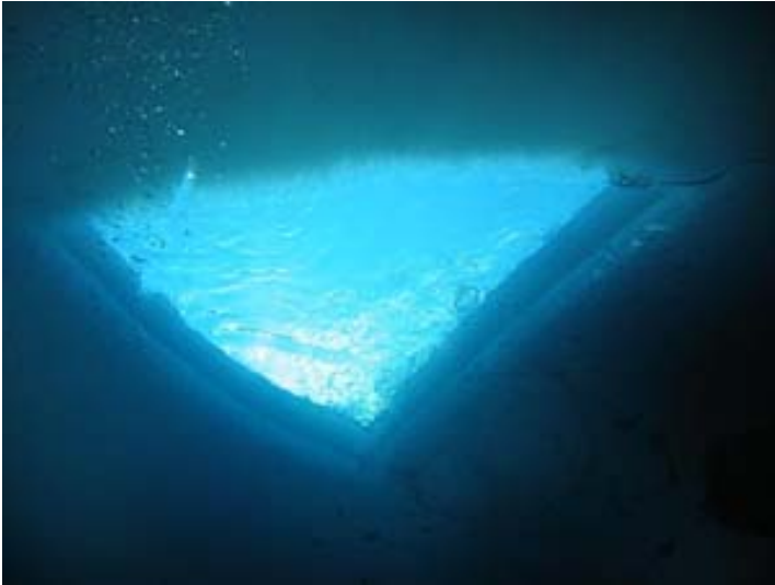
Jäänalle 2005.

Saarijärvi on Vaulujärveä merkittävästi kirkkaampi ja myös hieman syvämpi. Etenkin talvella Saarijärven vedessä on huikaisevan hyvä näkyvyys. Jäänalle 04 ja 05 -leirien aikaan vaakanäkyvyys vedessä oli useita kymmeniä metrejä. Järven pohja on pääosin hiekkaa. Hieman syvemmällä pohjassa kasvaa sammalen tapaista kasvillisuutta.