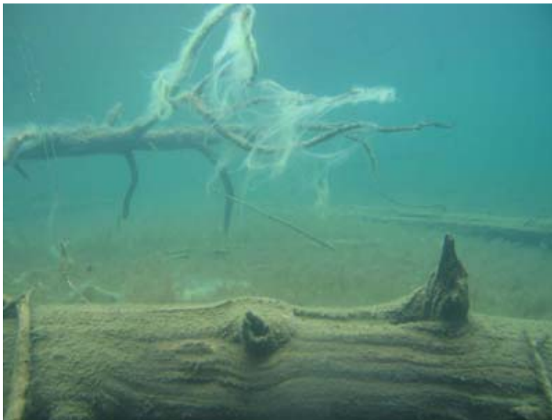
Joulupukin parta.

Manamansalon leiri ja Kattilankallan hylkyleiri ovat vielä vailla järjestäjää. Jos olet kiinnostunut leirin järjestämään, ota yhteys johtokuntaan. Kattilankallan leirin järjestämiseen vaikuttaa myös venetilanne: Viktorian huoltajia ja ylläpitäjiä kaivataan!