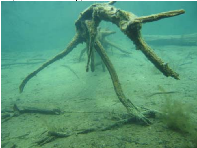
Hossan kuikelo.

Hossan sukelluskohteena on syvä ja kirkas Öllörijärvi. Järveen on rakennettu useita vedenalaisia lavoja, ohjauksoysoverkosto ja puurakenteinen ”luola”. Järven suurin syvyys on noin 33 metriä. Rantamatalassa on paljon kaloja ahvenista mateisiin sekä kasvillisuutta. Pohjassa on runsaasti järvimalmia, joten kompassi saattaa ajoittain näyttää väärin. Syvemmällä pohja on sedimenttiä ja mutaa. Vesi on kirkasta ja 30 metrissä näkee vielä ilman lampua. Rannassa on Metsähallituksen sukeltajille rakentama suoja sekä kompressoritila. Laiturilta pääsee suoraan 3 metrin turvapysähdyslavalle. Hossassa on majoitettu useimmiten kahdessa suurehkossa mökissä yhteismajoituksessa. Mökeissä on sähkösauna ja alueella puulämmitteinen sauna. Päärakennuksessa on pieni kahvila kauppa.