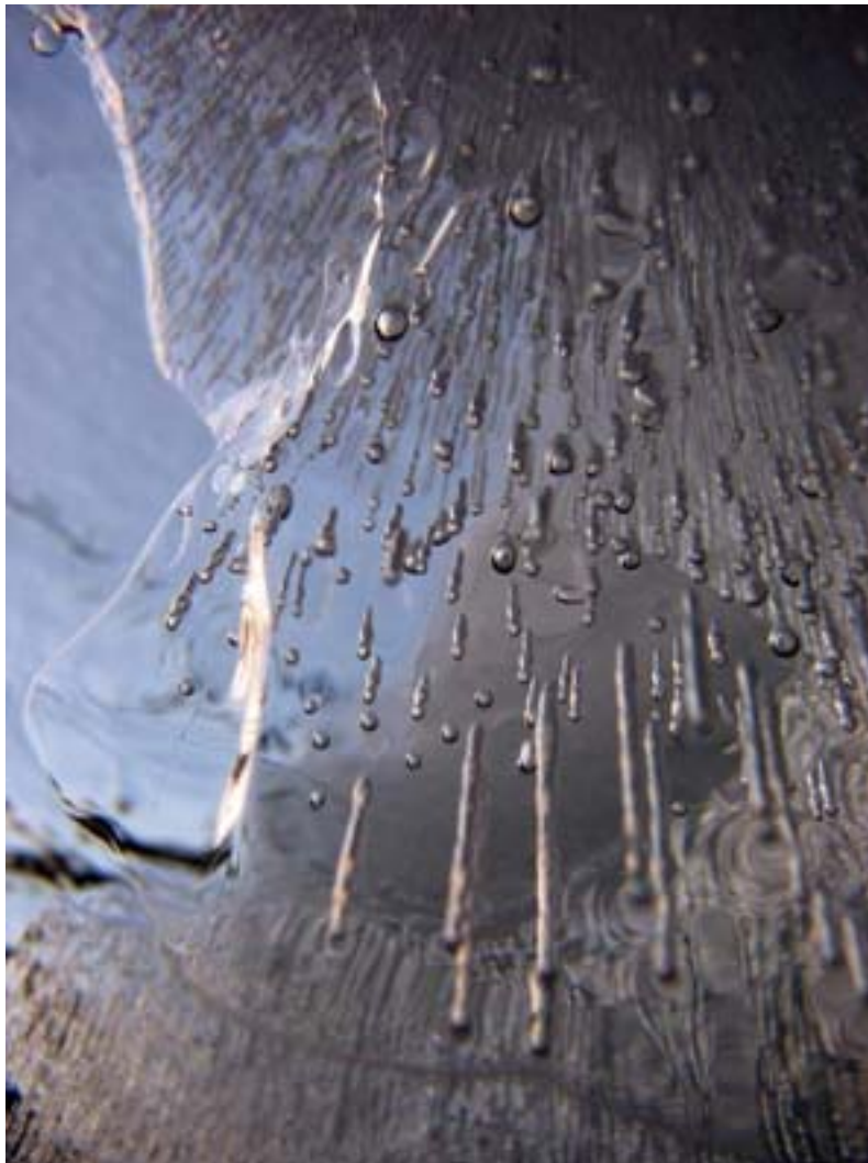
Jään alla 2005.

Oulun Vesimiehet Ry c/o Markku Heiskari Kuuselantie 4 90450 KEMPELE